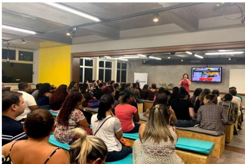
Foto: auditório como espaço de atividade prática, composta por bancos acolchoados