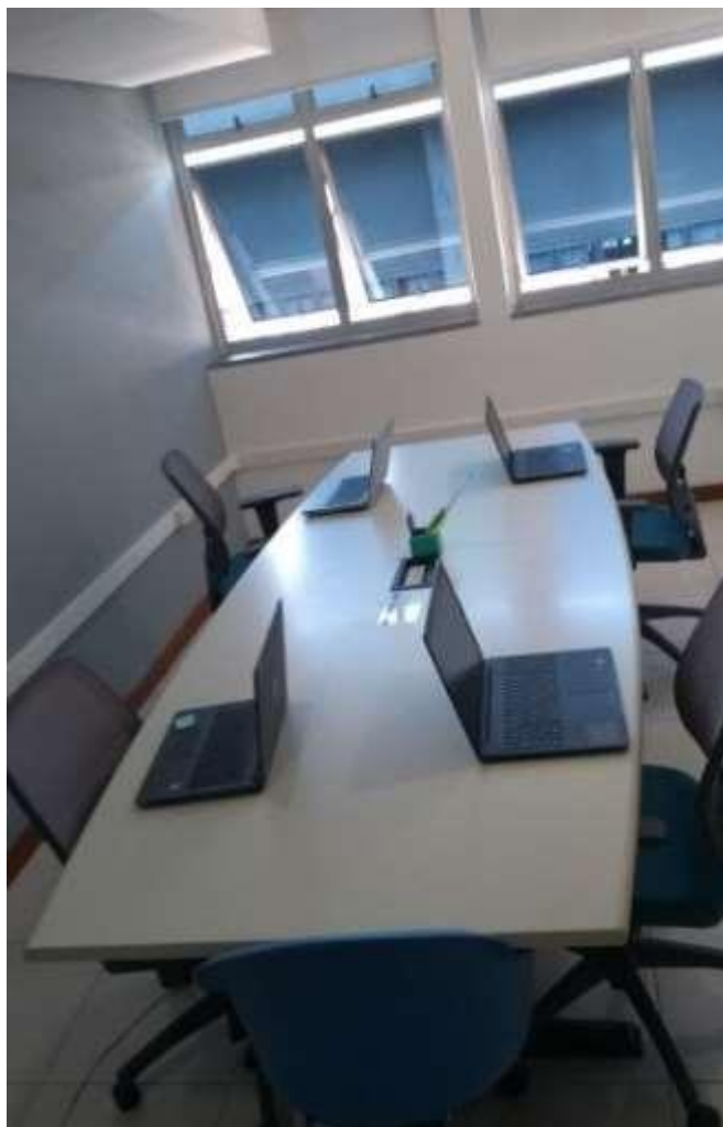
Foto: ambiente interno com mesa e equipamentos de suporte à equipe da CPA