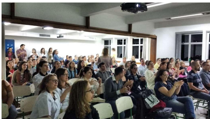
Foto: auditório com cadeiras, com capacidade para aprox. 100 pessoas