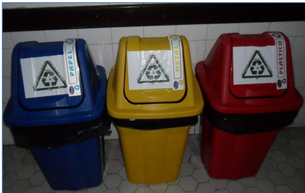
Coleta seletiva - Cestos de lixo por material distribuídos nos corredores da MEAC

Nosso objetivo é reduzir a zero o impacto dos resíduos de nossa atividade ao meio ambiente bem como ter cidadãos conscientes de seu papel nessa tarefa que deverá ser de todos. A consciência coletiva é o caminho que acabará com a devastação sofrida pela natureza, descartando corretamente em seus recipientes, bem como pela seleção eficaz dos resíduos comuns, recicláveis e sépticos.