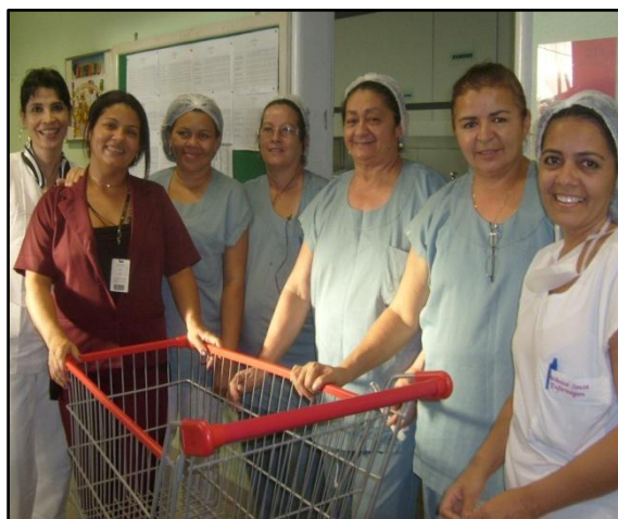
Colaboradoras da unidade neonatal da MEAC no processo de coleta seletiva.

O programa iniciou-se na MEAC desde maio de 2010 e vem trabalhando no sentido de implantar uma cultura voltada para a preocupação com o desenvolvimento sócio-ambiental dentro e fora da instituição, pois incentiva aos colaboradores a realizarem a coleta seletiva em seus lares.