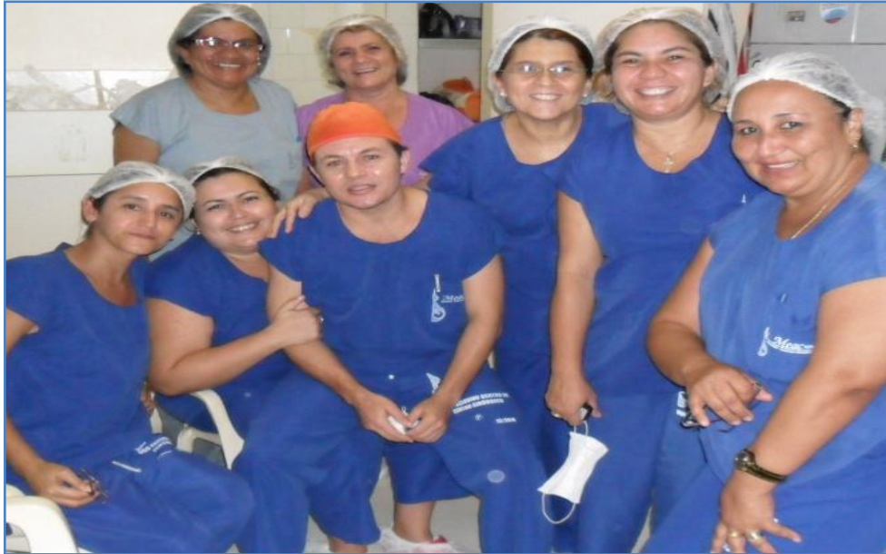
Funcionários do centro cirúrgico após palestra de sensibilização

Nosso objetivo é reduzir a zero o impacto dos resíduos de nossa atividade ao meio ambiente bem como ter cidadãos conscientes de seu papel nessa tarefa que deverá ser de todos. A consciência coletiva é o caminho que acabará com a devastação sofrida pela natureza, descartando corretamente em seus recipientes, bem como pela seleção eficaz dos resíduos comuns, recicláveis e sépticos.