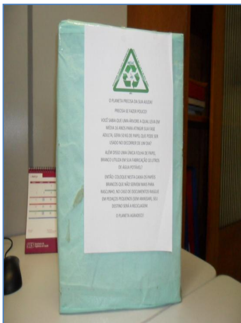
Caixa p/ coleta de papel distribuída nos serviços e unidades da MEAC

Iniciamos um plano piloto de coleta seletiva de papel, inclusive diferenciando em papel branco, papelão e papel comum. Em visitaç o, atentamos para a grave necessidade do consciente coletivo e conseguimos, a priori nos setores administrativos e em seguida nas unidades de internaç o, colocamos caixas de papel o para o descarte exclusivo de papel branco e de lixeiras identificadas "S  PAPEL", para os demais tipos, como jornais, revistas e outros.