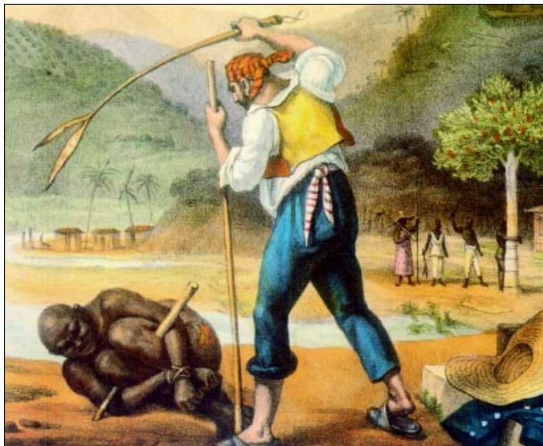
Figura 4 - Feitores castigando negros , de Jean-Baptiste Debret.