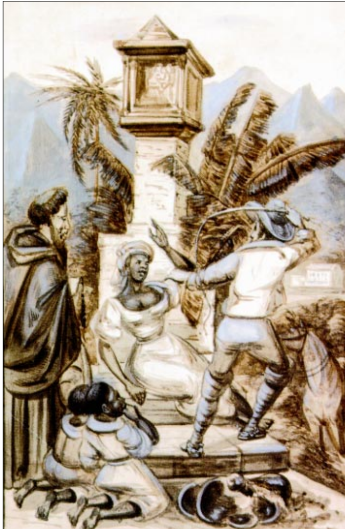
Figura 6 - Sem título , de Paul Harro-Harring