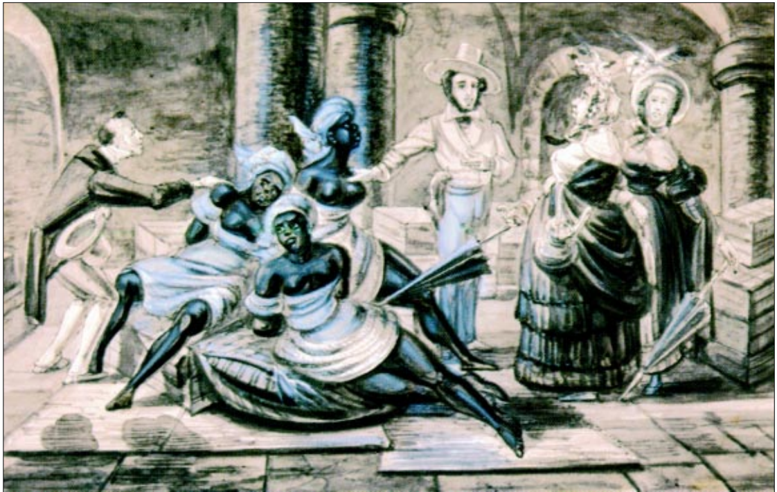
Figura 3 - Inspecção de negras recém-chegadas da África , de Paul Harro-Harring.