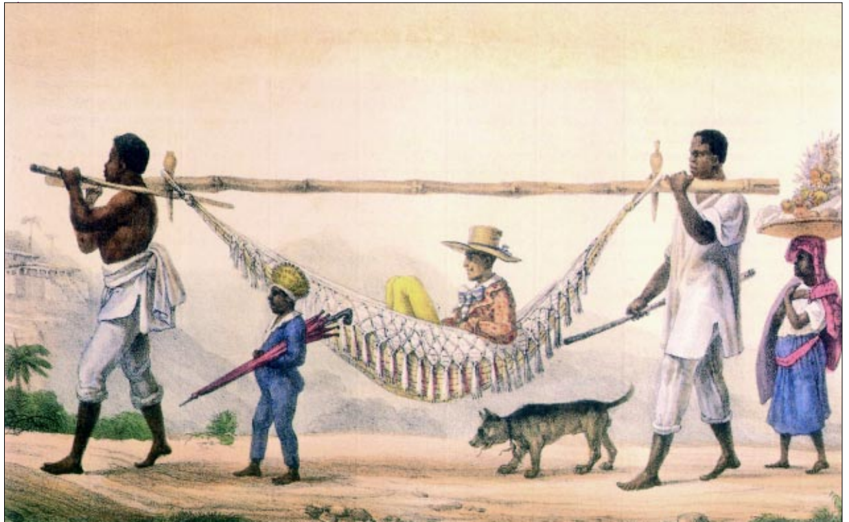
Figura 1 - O regresso de um proprietário , de Jean Baptiste Debret.