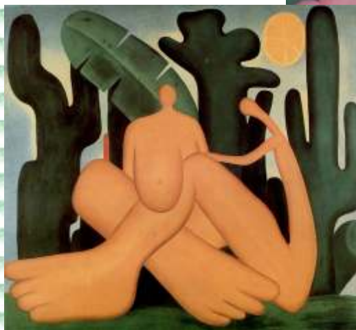
ANTROPOFAGIA, 1929 - Óleo s/tela - Coleção Particular-SP