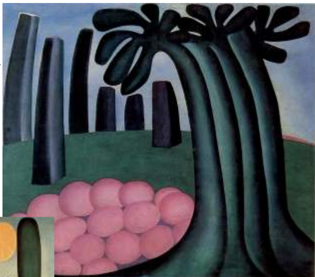
FLORESTA, 1929 - Óleo s/tela - Museu de Arte Contemporânea - USP-SP

aventura de ensinar arte nas escolas é sinônimo de saber “operar com a construção dos sentidos para si e para o mundo por meio de diferentes linguagens expressivas”.