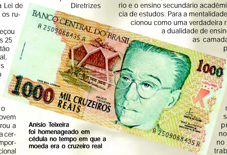
Anísio Teixeira foi homenageado em cédula no tempo em que a moeda era o cruzeiro real

É uma pena que Anísio não tenha conseguido seu maior reconhecimento de nós brasileiros: morreu em um acidente aos 70 anos, pouco antes da eleição que o levaria a ocupar uma das vagas da Academia Brasileira de Letras. Segundo Josué Montello, a escolha já estava feita. A eleição apenas ratificaria a decisão de colocar Anísio Spínola Teixeira entre as cabeças mais brilhantes da intelectualidade brasileira.