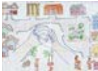
Escola Municipal Manoel Pedro dos Santos - AL