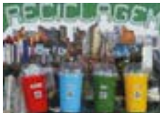
Escola não identificada - PR