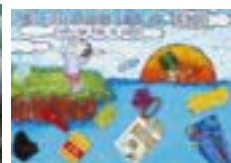
Escola Municipal Maria da Penha de Oliveira - RJ