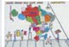
Escola Estadual Onesina Bandeira - TO