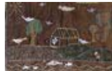
Escola Bosque do Amapá Módulo Regional do Bailique - AP