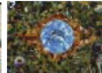
Escola Sagrado Coração de Maria - DF