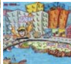
Escola Municipal Educador Paulo Freire - PE