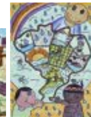
Escola de Educação Básica e Profissional Fundação Bradesco - PB