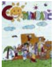
Escola Centro Integrado SESI/ SENAI - GO