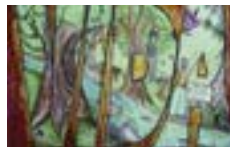
Escola Sebastião Teixeira Borges - MG