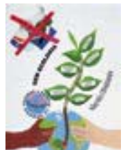
Ecoescola Thomas A. Kempis - PI