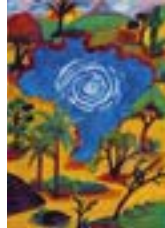
Colégio Municipal Coração de Jesus - BA