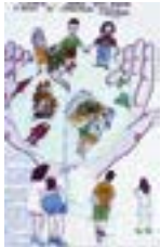
Escola Padre Antônio Diogo Feijó - AC