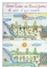
Escola Municipal de Ensino Fundamental 4 de Julho - MT