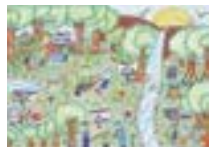
Unidade Integrada Prof. Robson Martins - MA