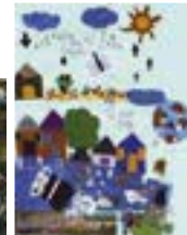
E. E. E. F. Sta Terezinha - ES