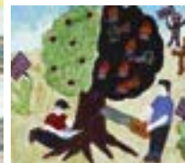
Escola de Educação Básica e Profissional Fund. Bradesco - PA