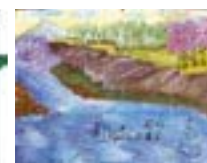
Escola Municipal de Ensino Fundamental Universitário - RS