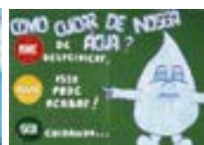
Escola Estadual Calpúrnia Caldas de Amorim - RN