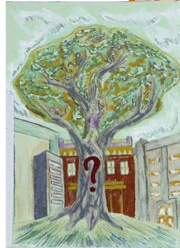
Escola de Educação Infantil, Ensino Fundamental e Médio Dom Ângelo Frozi - Barcarena / PA

Cada grupo escreve os seus sonhos num papel em forma de folha e prega na Árvore dos Sonhos. A negociação coletiva dos sonhos vai mostrar quais são os objetivos da Agenda 21 na Escola.