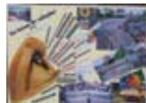
CEE.E.F.M. CAIC Raimundo Gomes de Carvalho - CE