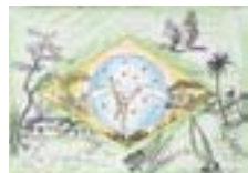
EEB José Maria Cardoso da Veiga - SC