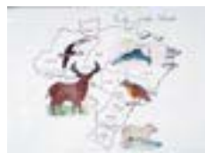
Escola Estadual Prof. Olga C. Farah - SP