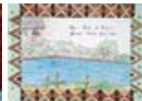
Escola Municipal Indígena Nãnde Iara Pólo - MS