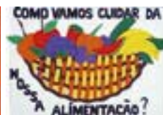
Escola Estadual São Vicente de Paula - RR