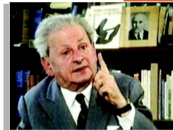
EMMANUEL LEVINAS 1 E 2