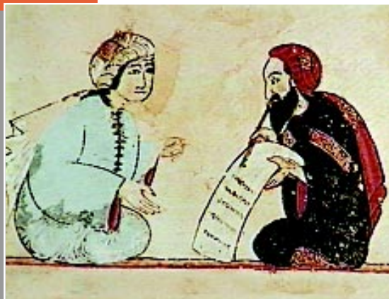
CLAC / FILOSOFIA

correlações falsas, mas os dados surgirão como elementos de verificação.