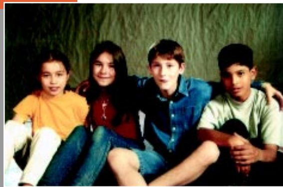
EU E VOCÊ – QUATRO CRIANÇAS E A FILOSOFIA