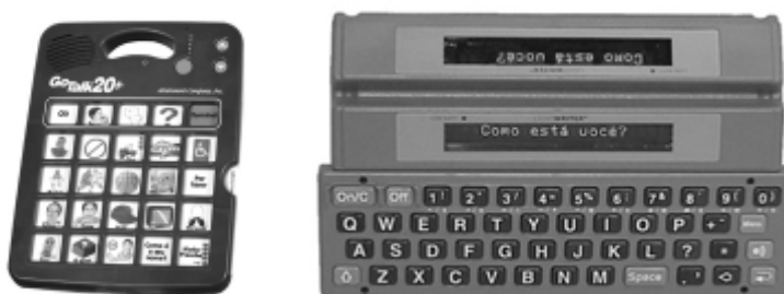
Exemplos de vocalizadores, com ou sem sistema de varredura.

Um serviço de CAA na escola será responsável por introduzir o aluno na CAA e por produzir recursos de comunicação. Idealmente, será composto por professor especializado, fonoaudiólogo, terapeuta ocupacional ou fisioterapeuta, que estarão em contato constante com o aluno e seu professor de sala de aula, a fim de manter a atualização dos recursos e vocabulário, à medida que avançam os conteúdos e projetos desenvolvidos na turma.