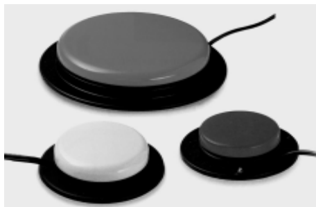
Ilustrações mostram teclado especial, mouse com adaptação e acionadores de pressão