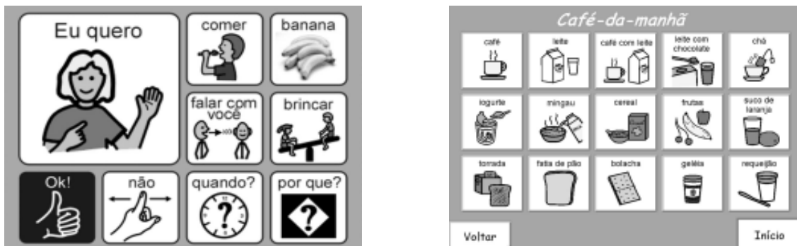
Exemplos de recursos de baixa tecnologia confeccionados com simbologia PCS – software Boardmaker

O acesso à mensagem poderá ser feito de forma direta, quando o aluno toca o símbolo que corresponde ao que deseja comunicar ou de forma indireta, através do olhar para o símbolo ou de algum sinal afirmativo, previamente combinado, que é emitido no momento que outra pessoa, ou um sistema de varredura automática, chega até a mensagem desejada.